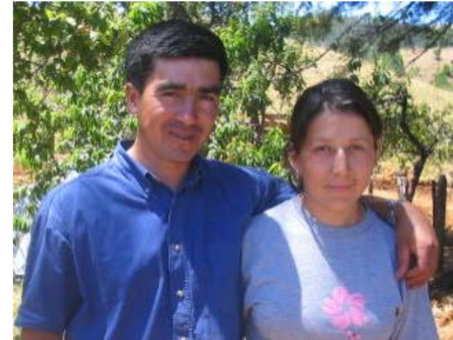
Familia Roa Muñoz Sector Camaguey, Alianza Taller Agrícola Las Ilusiones y Club Deportivo Camaguey, (Toltén)