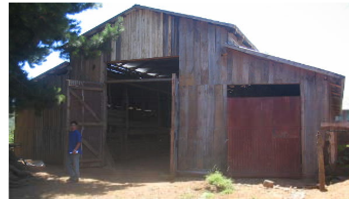
Este es nuestro establo