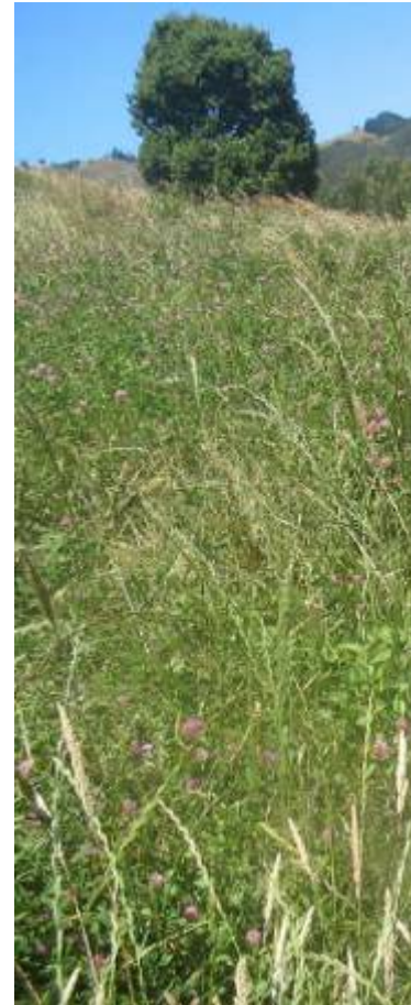
Esta es nuestra pradera, trébol rosado, ballica y pasto oville

Tenemos 30 hectáreas, 15 están sembradas con pasto, 10 hectáreas están todavía con pasto natural y tenemos 2 hectáreas de papa.