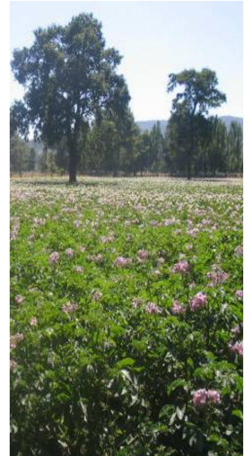
Así de bien produce la papa después de roturar la pradera sembrada